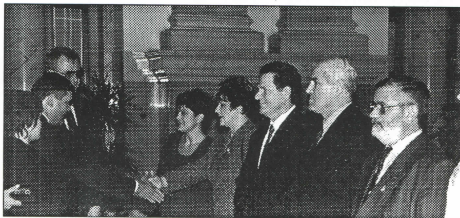
У САВЕЗНОЈ СКУПШТИНИ ДЕЛЕГАЦИЈУ ИЗ СЛОВАЧКЕ ПРИМИО ЈЕ др ШЕШЕЉ, У СВОЈСТВУ ПРЕДСЕДНИКА ПОСЛАНИЧКОГ КЛУБА СРС