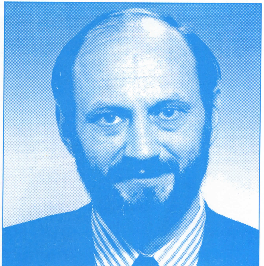
Др Никола Поплашен, председник Српске радикалне странке за Републику Српску

Српска радикална странка остаје доследна у борби за реализацију својих програмских одређења. Нисмо одустали од намере уједињења већине Срба у највећем делу историјских и етничких простора, од борбе за вишестраначку парламентарну демократију, од захтева за убрзаном приватизацијом где је то могуће и продуктивно, итд. Програм Српске радикалне странке у 100 тачака је једини озбиљан и уверљив страначки програм на српским просторима који гарантује демократску, слободну, независну и угледну српску државу и стабилно, просперитетно и отворено српско друштво. Једино остваривањем програмских одређења Српске радикалне странке можемо доћи до поштовања уставности и законитости, реда и рада, до ефикасне елиминације криминала, корупције и неморала који су,