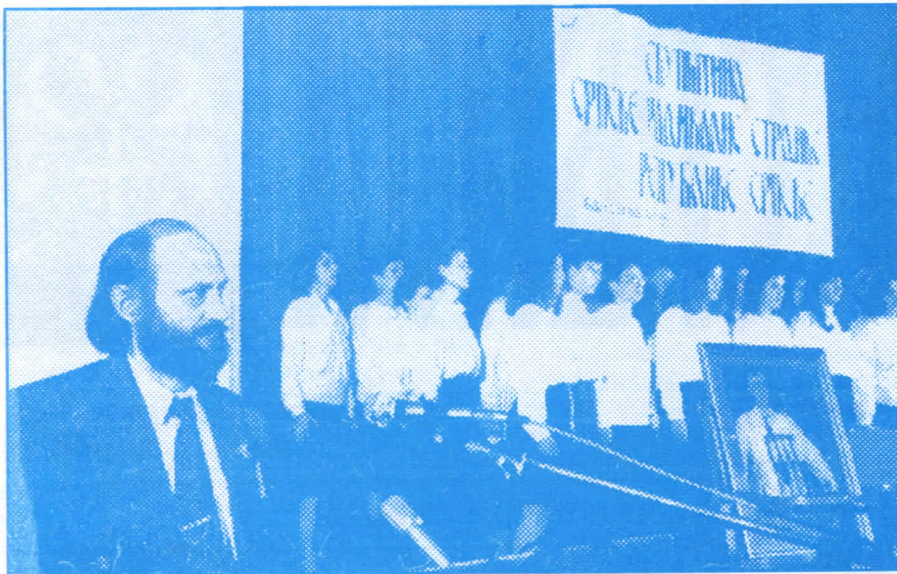
Бања Лука 20. марта 1993. године – скупштина Српске радикалне странке Републике

као опасан тумор, захватили све српске земље. Ове оцене потврђује и широка популарност Српске радикалне странке у народу као и фактичка победа српских радикала на парламентарним изборима у Србији. О томе говори и фактичка победа председничког кандидата српских радикала др Војислава Шешеља на председничким изборима у Србији.