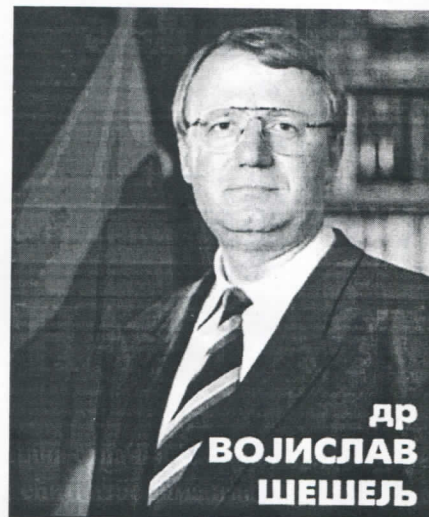
ДР ВОЈИСЛАВ ШЕШЕЉ

Међутим, то не би била стабилна влада. Та влада би имала много унутрашњих противречности, унутрашњих слабости, а непрекидно би се стварала све дубља тензија између владе и опозиције,