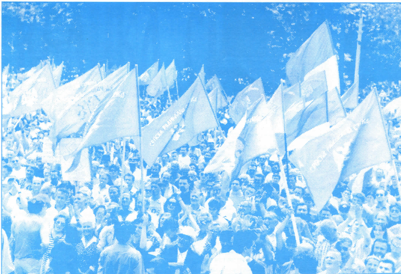
Српски радикали за Момира Булатовића

у Србији. Нека два Србина, нека два брата уједине ову нашу раздвојену кућу, нека је ставе под исти кров, на исте темеље. И нека у кући живе равноправна чељад. А Момир Булатовић и Војислав Шешељ водиће бригу и водиће рачуна да у кући ниједно дете не заплаче, да у кући нико не буде гладан, да у кући не буду никоме ускраћена права која му припадају. И да у кући сви извршавају своје обавезе.