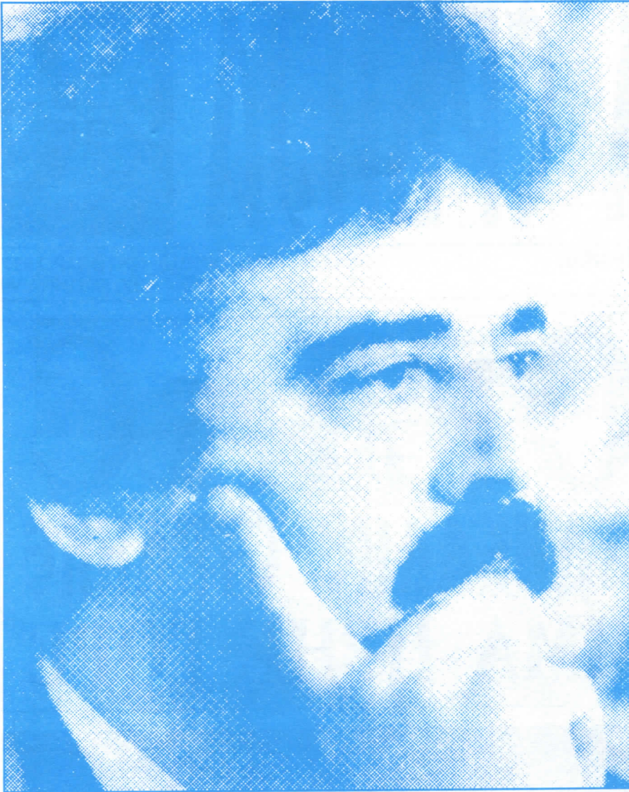
Момир Булатовић: "Црна Гора без Србије и Србија без Црне Горе не могу да постоје"