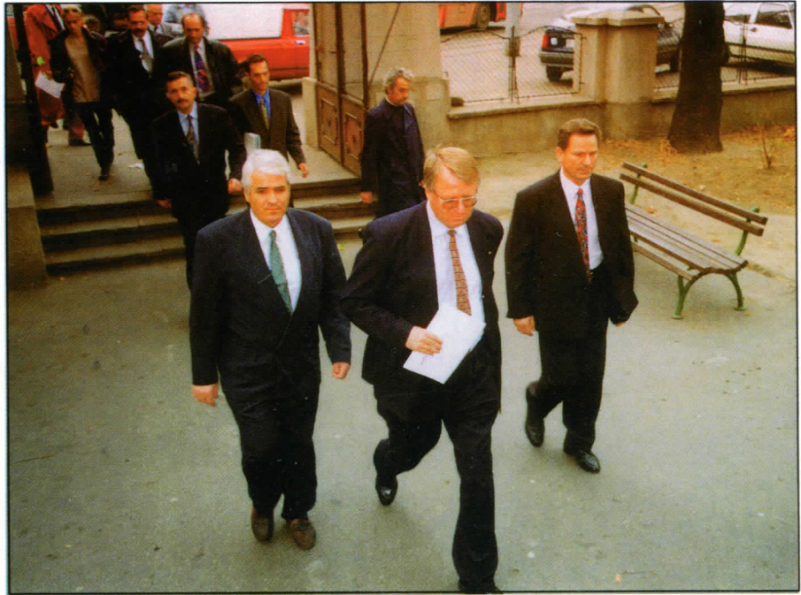
Др ВОЈИСЛАВ ШЕШЕЉ И ДРУГИ САВЕЗНИ НАРОДНИ ПОСЛАНИЦИ СРПСКЕ РАДИКАЛНЕ СТРАНКЕ УЛАЗЕ У ЦРКВУ ДА БИ ПОЛОЖИЛИ ЗАКЛЕТВУ

Као најбољи пример да је др ВОЈИСЛАВ ШЕШЕЉ права личност за Председника Републике Србије, може послужити општина Земун у којој је он градоначелник и где је доказао како треба организовати локалну власт и какав треба да буде њен однос према грађанима. Тај пример може бити поука за целу Србију.