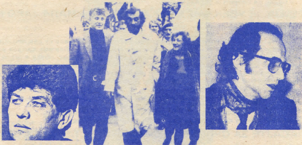
Ови су показали да су још горе решење