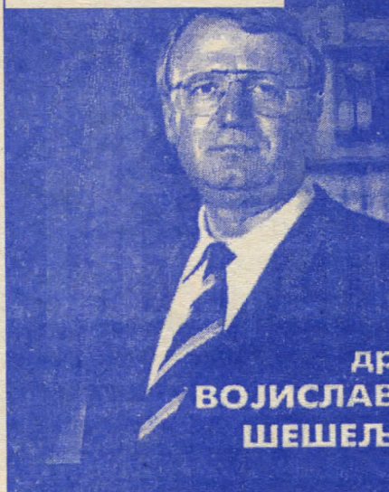
Др ВОЈИСЛАВ ШЕШЕЉ