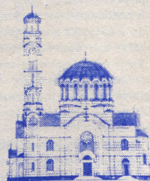
Спомен храм у Теслићу (макета)

Овај богоугодни чин обухватао је молитву у Цркви Светог пророка Илије, свечану литију кроз град до темеља Храма, изборку темеља, освећење темеља Храма, поделу захвалница ктиторима, задужбинарима и прило-