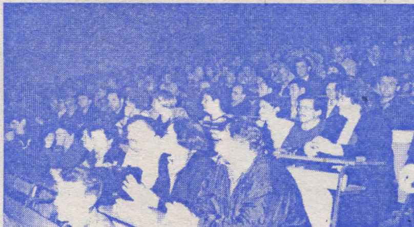
Са трибине српских радикала у Теслићу

"Локална власт или безвлашће.?" Интерес грађана за овај вид политичке комуникације, премашио је сва очекивања организатора. То показује не само чињеница да је у пет мјесних центара (Прибинић, Чечава, Теслић, Очауш и