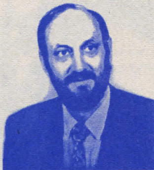
Др Никола Поплашен