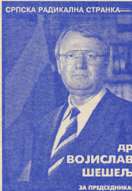
ДР ВОЈИСЛАВ ШЕШЕЉ ЗА ПРЕДСЕДНИКА!

Виспрен. Сналажљив. Прилагодљив Груб. Мек. Благоглагољив. Ћутљив. Нем. Уста не затвара. Националиста. Светски човек. Уски видици. Широке границе. Широке руке. Непопустљив. Политичар. Прави. Радикал. Синоним Српске радикалне странке. Војислав Шешељ.