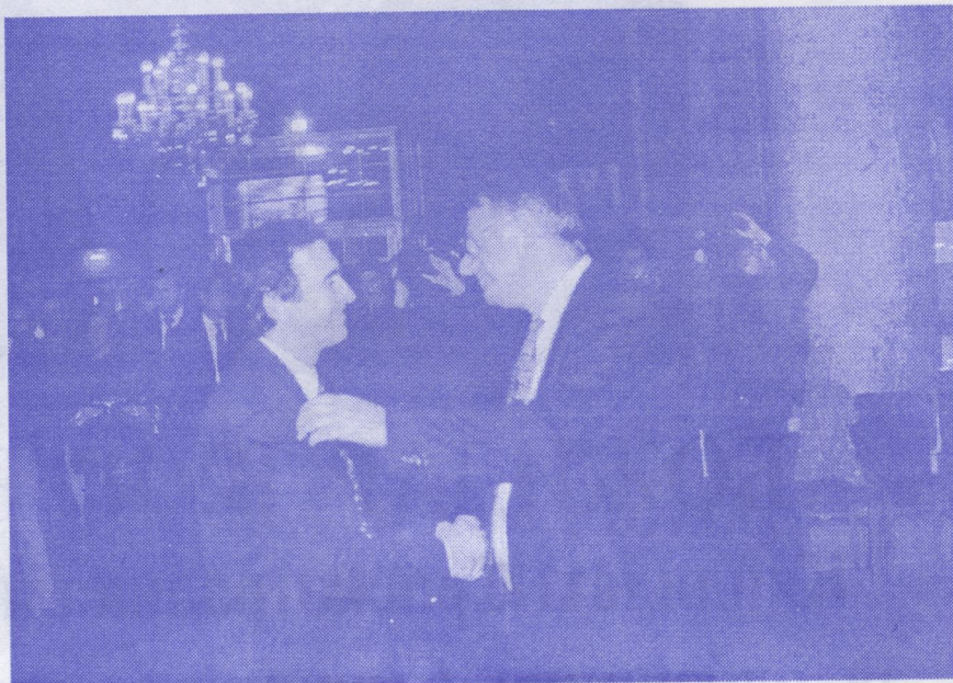
Ми смо овако схватили изборне резултате, и заклели се пред Богом и грађанима Београда

Тражите да врате ваше гласове, да их врате на бирачким листићима. Сваки ваш глас на бирачком листићу је јачи од хиљаду гласова на улици.