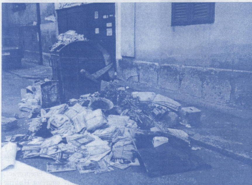
„Европолис” градоначелника Човића – српски радикали су за чистији, богатији и безбеднији Београд

Пошао бих од самих темеља, дакле од локалне самоуправе. У свим, када кажем у свим, мислим то у најбуквалнијем смислу те речи, због чини ми се - намерно лоше спроведене поделе овлашћења између органа локалне самоуправе и државне управе у свим општинама створена је огрома конфузија.