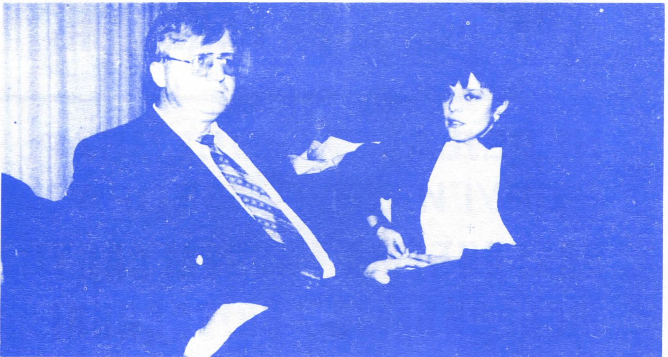
Победићемо: Др Војислав Шешељ и Маја Гојковић

и територијалне целовитости српске државе, као ни стварање аутономних области, које би у блиској будућности обезбедиле прерогативе државне власти. Српска радикална странка, поштујући српску традицију, сматра да права националних мањина морају бити загарантована у складу са највишим европским стандардима, а заштита права и слобода сваког појединца представља један од показатеља стварног поштовања принципа равноправности и једнакости грађана. Сви они који признају српску државу имали би апсолутно иста права и дужности без обзира на националну или верску различитост.