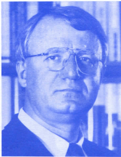
ДР ВОЈИСЛАВ ШЕШЕЉ