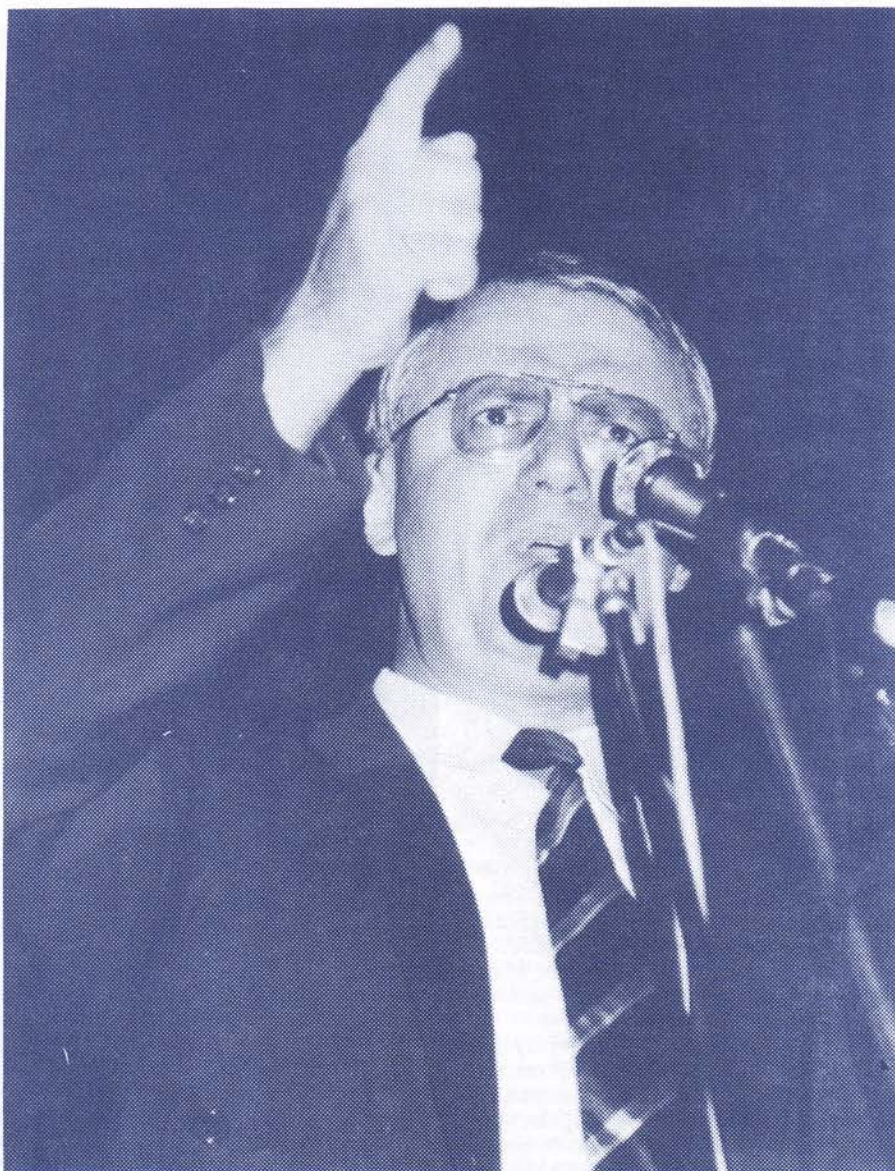
Др Војислав Шешел

Зато, због, свега што нам је као народу учинио, и он и његова партија морају да оду са власти!