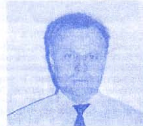
изборна јединица 38 МЗ "Гаково"