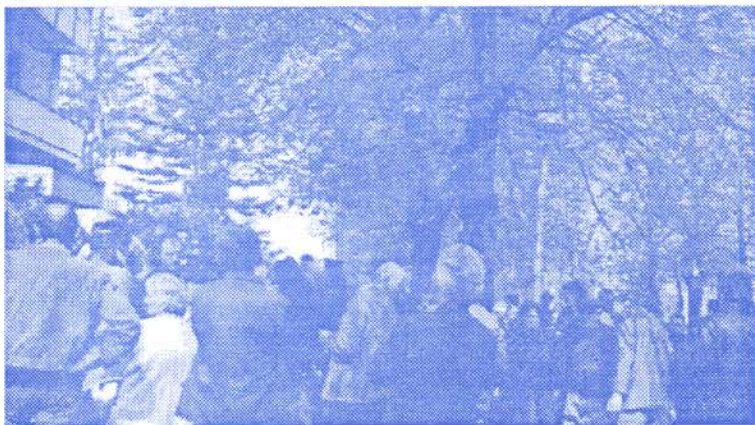
Петак, 26. април, 1996. Све чешћа слика на улицама Куле: протест обесправљених

Редакција издања „Велике Србије“ за Кулу