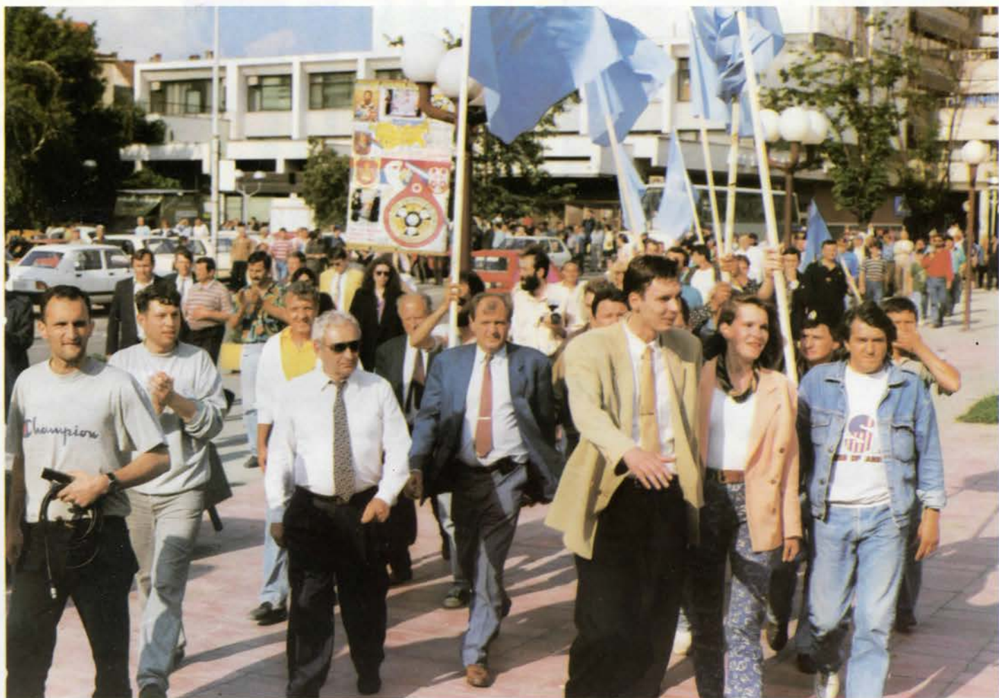
Владимир Башкот на митингу Српске радикалне странке у Смедереву