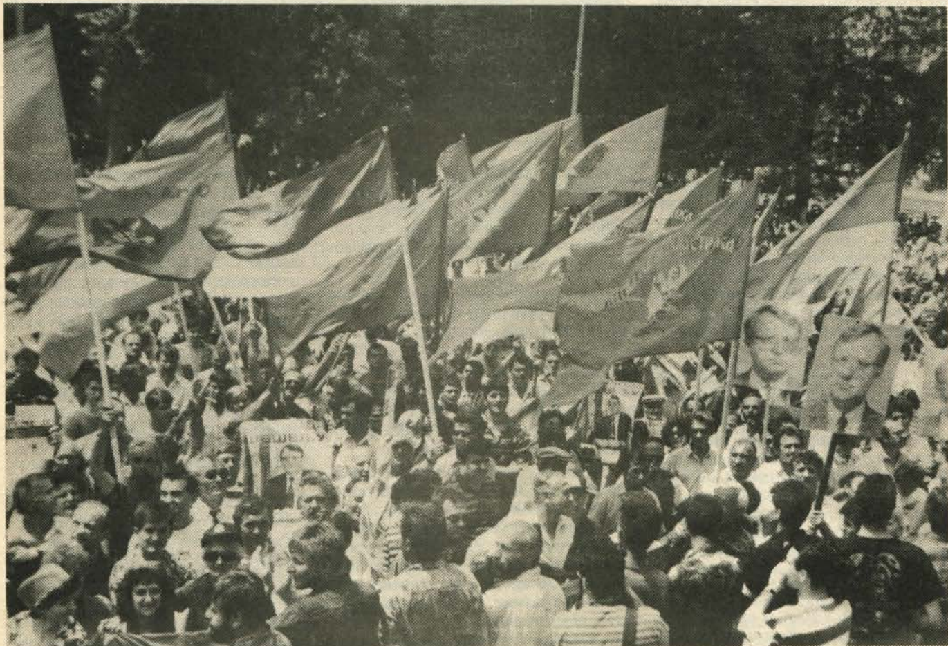
Протести српских радикала испред Савезне скупштине поводом хапшења др Војислава Шешеља

– Стварање урбанистичке и грађевинске мафије која је за врло кратко време урбанистички унаказила и опустошила Београд.