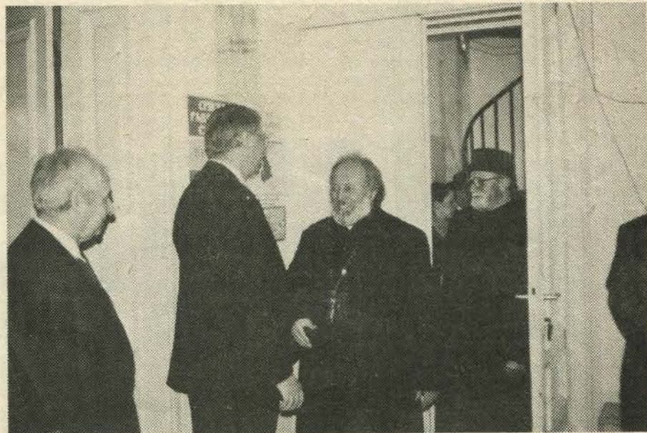
Долазак свештеника на славу Српске радикалне странке

Наравно, никада, али заиста никада не бисмо спречили или на било који начин ометали сличну иницијативу било које верске групације са територије Општине Земун, која је, наравно у стању да сама исфинансира градњу свог храма.