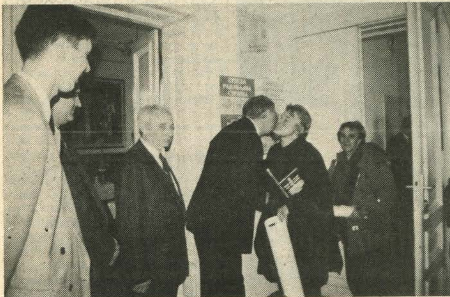
Владимир Башкот домаћин славе Српске радикалне странке дочекује госте