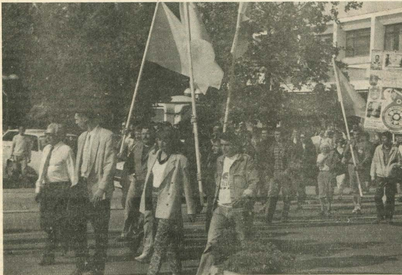
Са митинга у Смедереву

Такође је важно да државно предузеће – Градско саобраћајно Београд нема овакав монопол какав сада има у