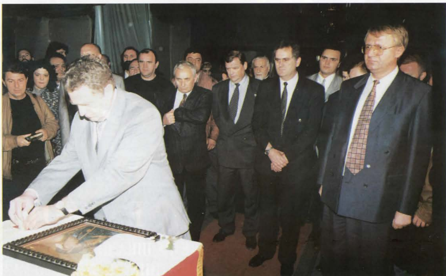
У Саборној цркви