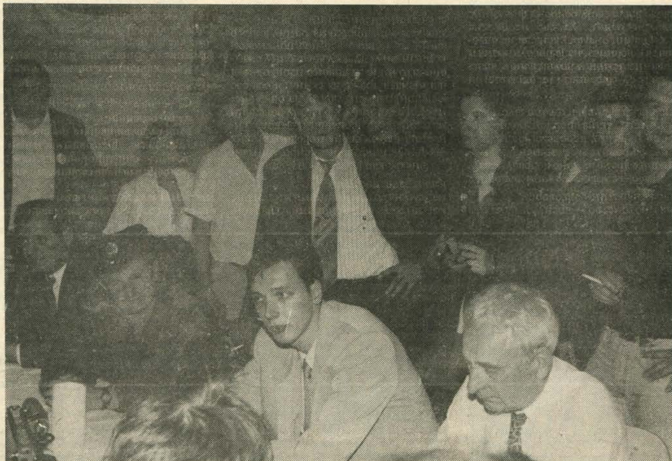
Договор пред митинг у Смедереву

Да бих у одговору на Ваше питање избегао патетичне формулације толико својствене овом режиму, попут оне о томе да су "деца наше највеће богатство", иако то заиста мислим, али се ми у Српској радикалној странци не заустављамо само на вербалној равни показивања љубави и бриге за