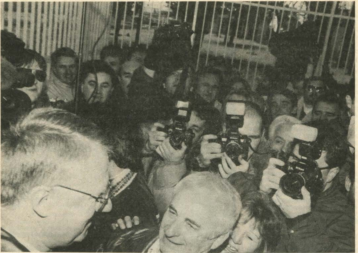
Излазак из затвора др Војислава Шешеља