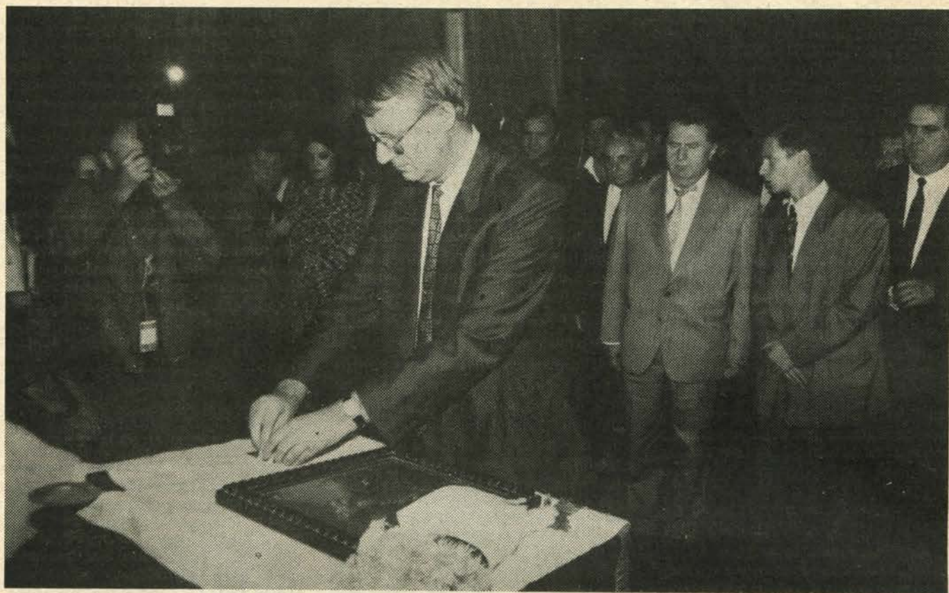
У Саборној цркви