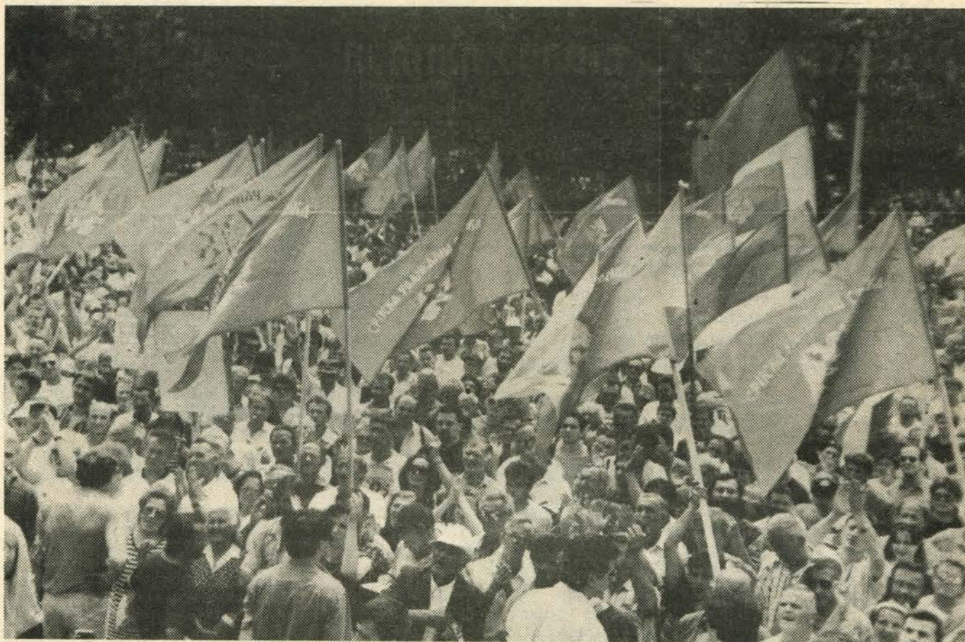
Митинг Српске радикалне странке

ти омогућио је општини и граду самостално доношење статута и других општих аката што је резултирало преузимањем вршења власти на овом нивоу; преузимањем атрибута државе од стране ових територијалних јединица. По досадашњем систему организовања општина и град су попримили облике власти иманентне искључиво држави, копирају комплетну државну структуру и њене ингеренције персоналификоване у општинским и градским чиновницима, што је поред осталог довело до правног апсурда да грађанин нема исти статус на територији целе земље.