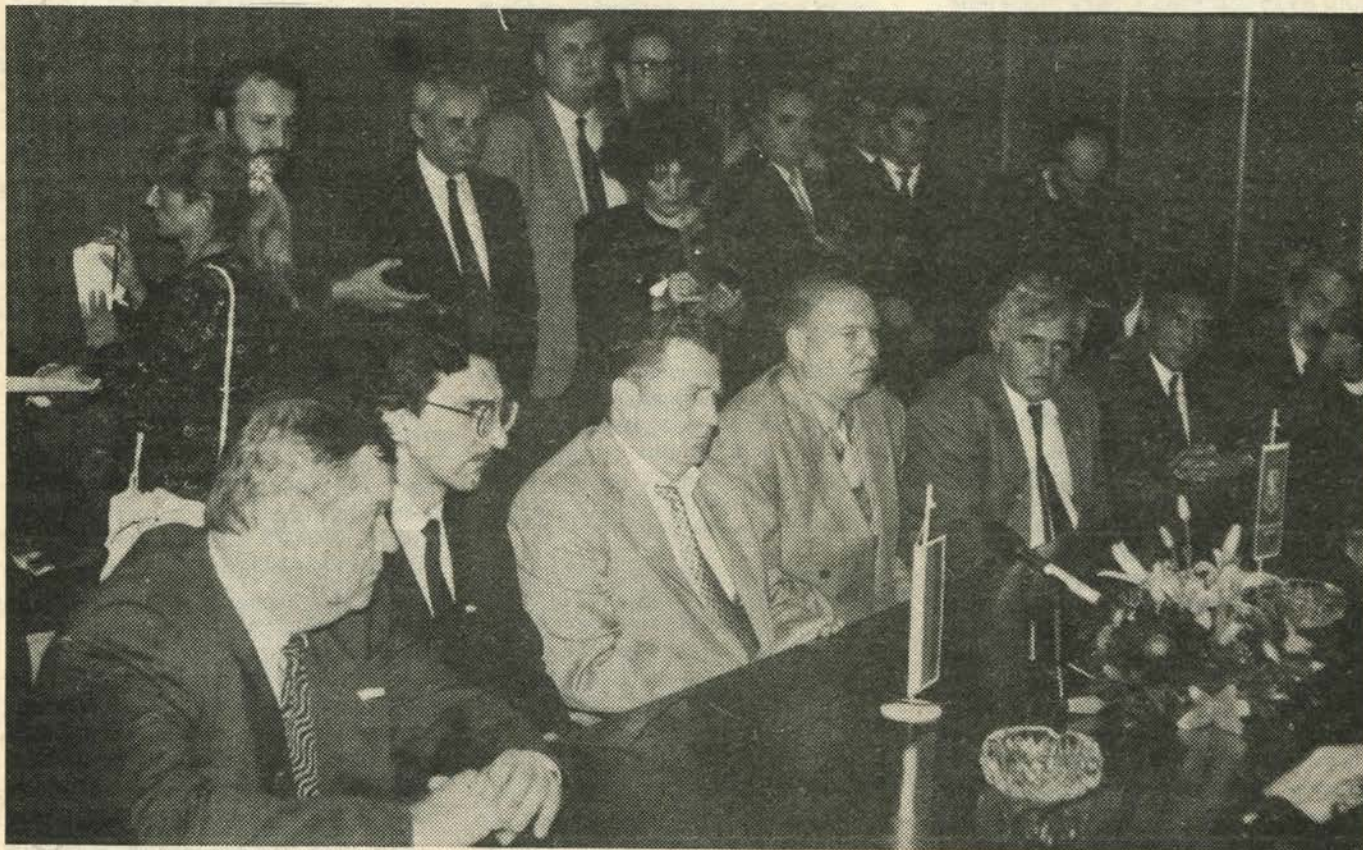
У Народној скупштини Србије

Вратио бих се у овој својој причи, поново на секретаријат, у коме, уосталом, поред куће и свог радног места у фирми, и проводим највише времена. Волео бих да кажем нешто о људима са којима у секретаријату радим. Наравно, неке од њих познавао сам и од раније али није то било право познанство. Ја верујем да човека можеш најбоље да упознаш баш кроз заједнички рад, односно сарадњу. На самом почетку, пре свега, био сам им бескрајно захвалан због начина на који су ме,