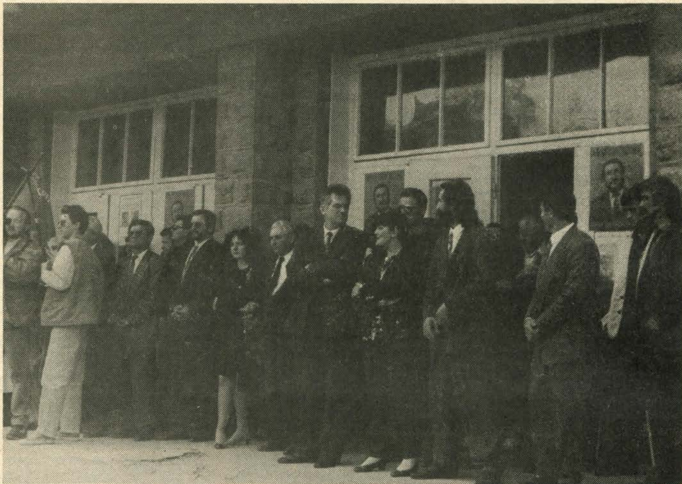
Протестни митинг у Пљевљима поводом хапшења Аћима Вишњића

нашем градском саобраћају. Значи, мора се развити приватно предузетништво у оквиру ове гране и учинити све да се дозволи слободна конкуренција, дакле да нико не монополише одређене саобраћајне линије, већ да – уколико људи имају интерес, обављају превоз на одређеним релацијама. Не морам да вам посебно причам о томе колико би све то онда било и пријатније, удобније и брже и јефтиније.