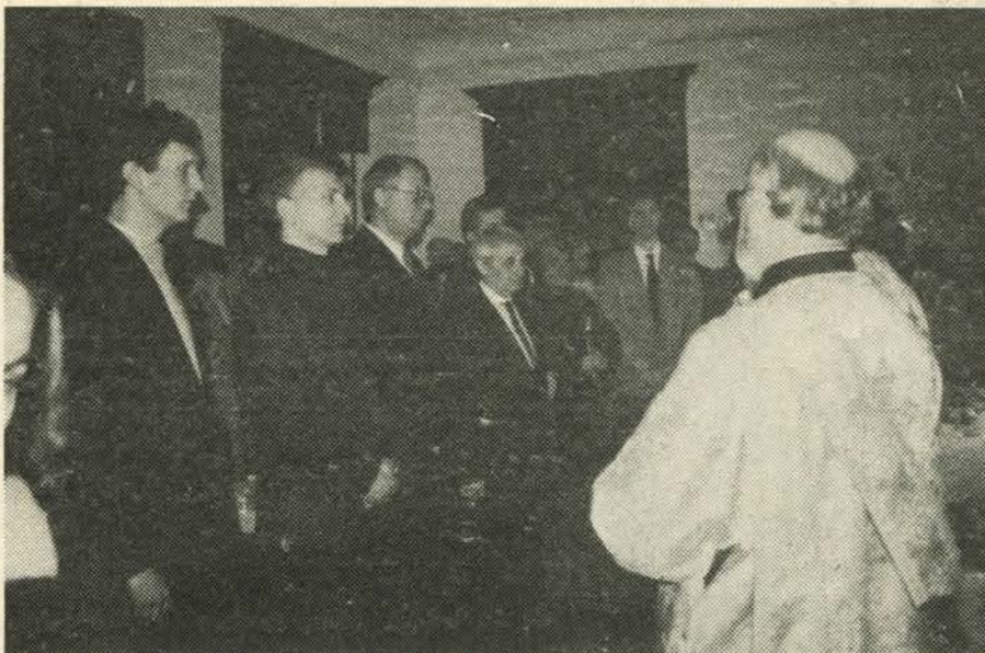
Прослава Света Три Јерарха у седишту Странке

држава Афричког континента, желе да нас воде у 21. век!