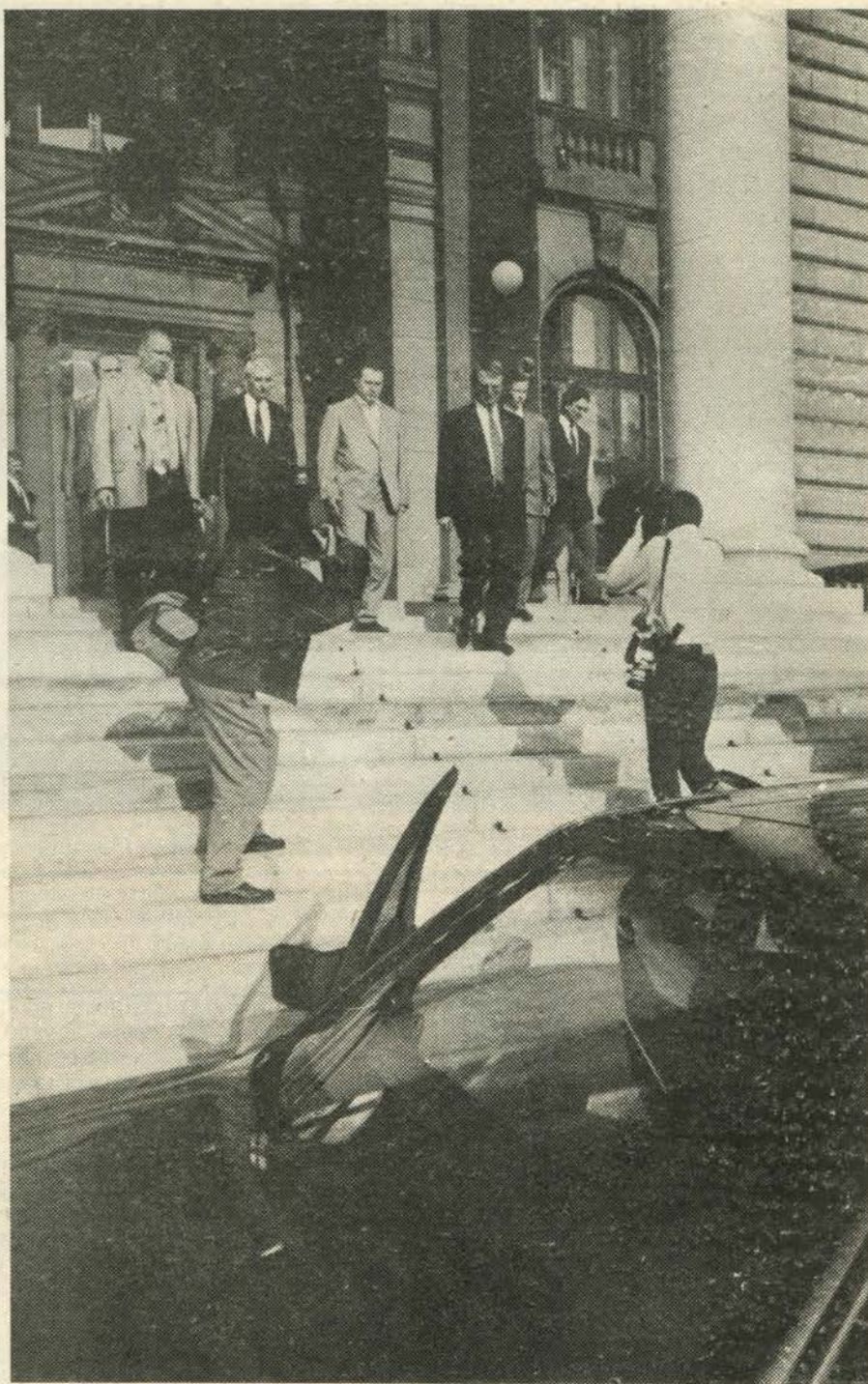
Пред Савезном скупштинском

Упореда са мојим преласком у приватнике, почиње и интересовање за политику. На самом почетку, то интересовање није прелазило ниво општо-