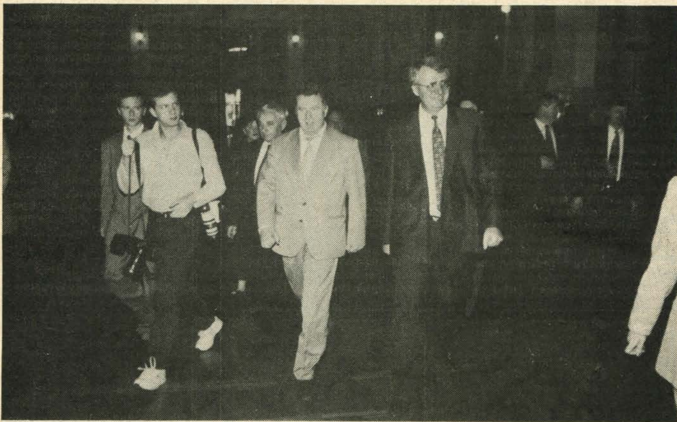
Са др Шешељом и Жириновским у Савезној скупштини

успео да направим неку врсту породичног стабла, ако није претенциозно да то тако назовем, за четири колена уназад. Успео сам још и да дођем до податка да је место из кога потичемо – Сурдук настало, односно насељено за време велике сеобе под Чарнојевићем. Знате да је он један део Срба оставио, да тако кажем, ту у околини Сурдука и Старог Сланкамена, један део у Банату, један нешто северније – у Бачкој, а један је део стигао све до територије данашње Мађарске.