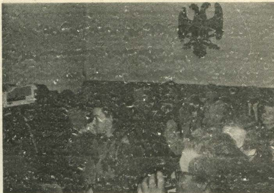
Са конференције за новинаре Српске радикалне странке

Српска радикална странка ће из система предузећа издвојити и препустити процесу приватизације све оне пратеће делатности као одржавање, развој, инжењеринг и сл. а поступком лицитације ови послови ће бити понуђени деловима који су били у саставу "Београдских електрана" и другим, приватним субјектима. Кроз лојалну конкуренцију обезбедиће се јефтиније, ефикасније и квалитетније обављање ових послова. Део послова производње, транспорта и испоруке топлотне енергије биће организован као јавно предузеће и остао би у власништву града.