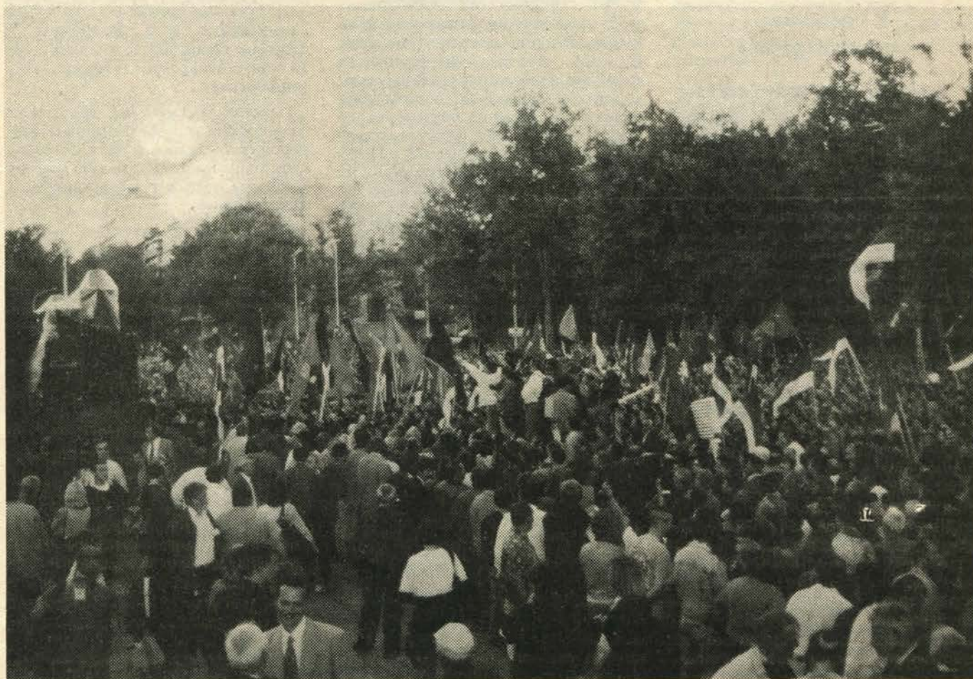
За Београд без комунистичке диктатуре

Само у овом делу комуналне делатности јасно се види сва громост и незаинтересованост ових предузећа за стицање дохотка и за домаћинско пословање. Због монополског положаја водовода и канализације у граду и сигурног прилива средстава предузеће није заинтересовано да реши основни проблем који грађане Београда данас мучи, а због чега ово предузеће и постоји, да становницима града обезбеди довољне количине здраве