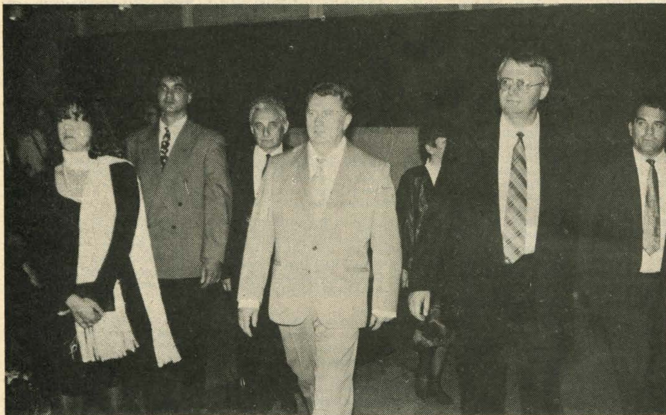
На пријему уприличеном поводом посете Владимира Волфовича Жириновског

кажу да јесу Срби и да су национално и патриотски одређени и одређени – оптуге за то да су националисти и шовинисти. Заборављају они, при том, да имајући у виду неколико дефиниција "националисте" нема ничег лепшег и чистијег од тога. Јер, националиста је човек који воли своју нацију и који има изузетно јасна патриотска осећања према свом народу. Тога се не стидим и због тога могу да будем само поносан.