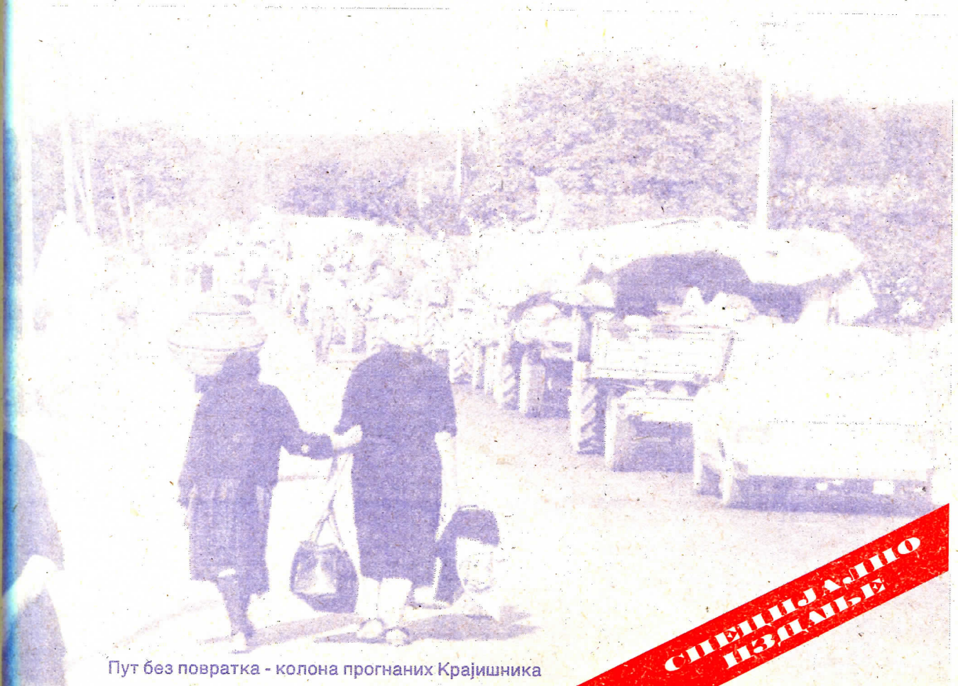
Пут без повратка - колона прогнаних Крајишника

ЦРВЕНИ ТИРАНИН СЛОБОДАН МИЛОШЕВИЋ ОТВОРЕНО ИЗДАЈЕ СРПСКЕ НАЦИОНАЛНЕ ИНТЕРЕСЕ