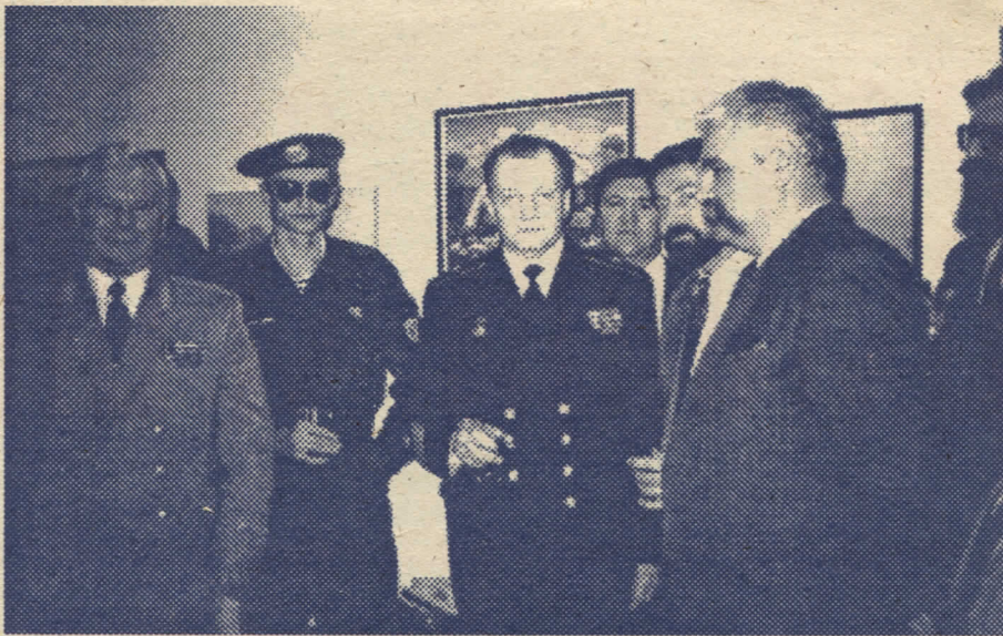
Са групом високих руских официра

Зајући да је за голготу српског народа и губитак највећег дела територије Републике Српске Крајине одговоран једино дедињски тиранин Слободан Милошевић, покушао је да настави сарадњу са толико нападаним крајишким председником Мартићем и другим челницима Крајине, због наставка борбе за враћање и последњег педља српске земље, до коначне победе и ослобођења.