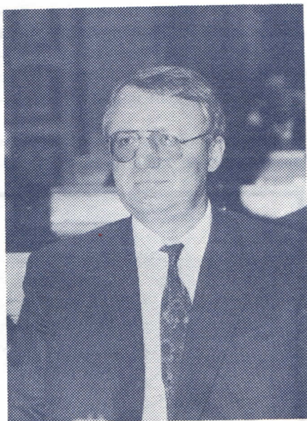
др Војислав Шешељ

Сада су схватили своју грешку, али док су се они освестили и сабрали ето новог проблема. Српски радикали заказали митинге по целој